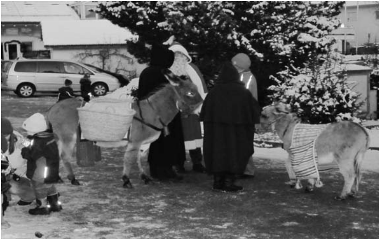
Der Chlaus hat auch die Eseli mitgenommen