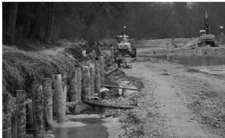
Blick auf die ganze Baustelle: Links die Ufersanierung, rechts Arbeiten am Streichwehr

beschädigte, dass eine Sanierung dringend notwendig wurde.