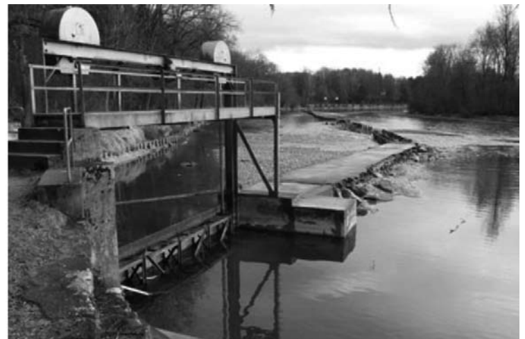
Das Streichwehr vor der Sanierung

Vor hundert Jahren blühte die Textilindustrie an der Reuss und die Webstühle ratterten um die Wette. Eine wichtige Rolle dabei spielte die Wasserkraft. Nach zwei Hochwassern werden die denkmalgeschützten Wasserbauten nach altem Vorbild saniert.