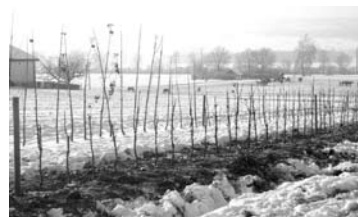
Die Malus Procats in Reih und Glied

In Sachen Obstanbau gibt es in der Schweiz momentan eine Zweiteilung: Tafelobst wird in Niederstammkulturen angebaut, und die Ernte der Hochstamm-bäume wird hauptsächlich zu Most verarbeitet. Leider sind die klassischen Obstbäume für viele Landwirte auch problematisch – sie verursachen viel Arbeit bei der Pflege und sind leider auch vom Feuerbrandbefall gefährdet. Fachleute weisen auch darauf hin, dass viele Hochstammkulturen überaltert und mangelhaft gepflegt sind. Bis jedoch Neupflanzungen solcher Bäume einen entsprechenden Ertrag abwerfen, dauert es viele Jahre.