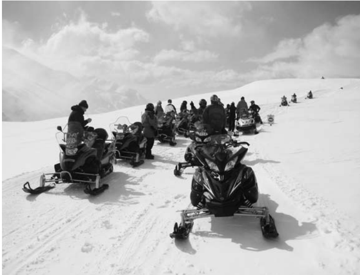
Unterwegs mit dem Sky-Doo

Im Rückblick schauen wir auf die Hauptversammlung der Schützen zurück. Es gab keine ausserordentlichen Traktanden und so wurde diese sehr speditiv abgehalten. Bereits einen Tag danach erfolgte die erste «Nicht-Kernaktivität» der Schützen, nämlich das Lotto im Restaurant Frohsinn. Leider blieb ein Grossteil der Dorfbevölkerung an diesem Anlass aus, was ein eher geringer Ertrag für die Schützenkasse ergibt.