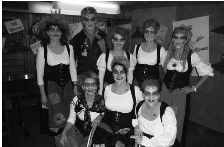
Wir sind bereit – die Häxebar kann öffnen!

Am Sonntagmorgen holten wir unsere schöne Schachenburg her-